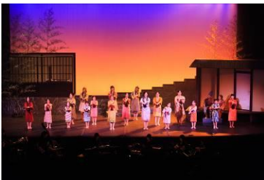
平成27年度 「羽衣」～つるの物語～