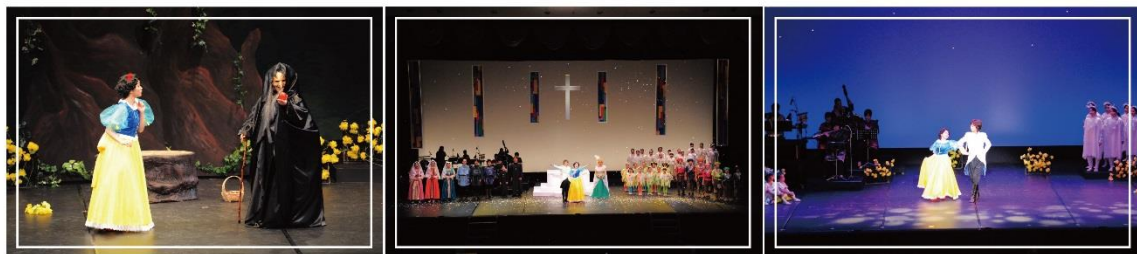
平成29年度「白雪姫」公演の様子