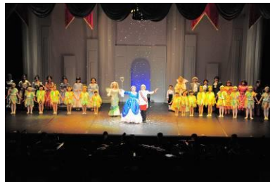
平成28年度 「シンデレラ」