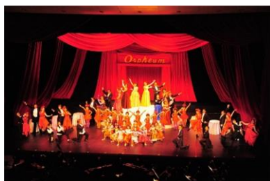
令和元年度 「チャルダッシュの女王」