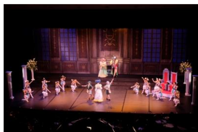
令和4年度 「夏の夜の夢」