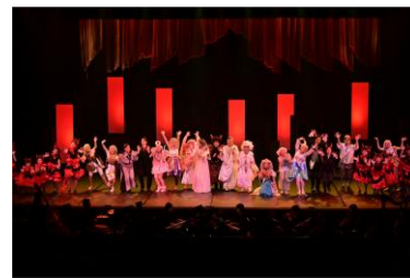
令和6年度 「天国と地獄」