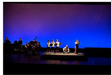
令和7年度 「平和を見つめて（少年口伝隊）」