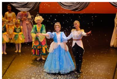
令和5年度 「シンデレラ」