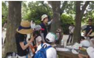
リトマス試験紙を使って土を調べてみよう