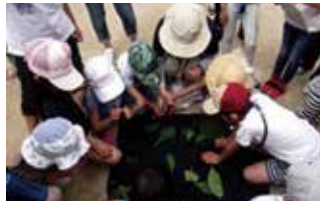
同じ形の葉っぱはどれかな？

一転して「空を見上げてごらん。いろいろな雲があるね」「今から気象館の上の雲に名前をつけましょう」と講師が呼びかけた。「昔から人は、朝一番には空を見上げて一日を始めたんよ」「みんなも雲の流れや、風の音、匂いを感じてごらん」と話を聞きながら、参加者も大自然に包まれている感覚をそれぞれに体感しているに違いない。「X(エックス)雲」「ガイコツ雲」の声が聞こえる。子を膝に乗せ親子で空を仰ぐことも身近な自然体験であろう。自然を楽しみながら感じる