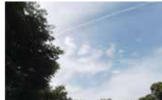
見上げるといろんな形の雲が