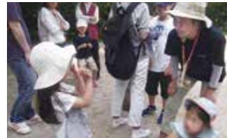
雲を観察して名前を付けたよ！