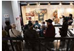
現役ボランティアの勉強会風景(広島城)