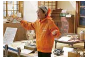
ガイドを実演してもらう。(郷土資料館)

中15人が参加され、城内で開催中の現役ボランティアのための勉強会「定例会」を参観し、観光客へのガイドの様子も見ました。「郷土資料館」では、初回の説明会でも話を聞いた先輩ボランティアが、得意のガイドぶりを実演しました。会場で幾人かの人と話をしましたが、意外だったのは、歴史好きな人ばかりではなかったことです。退職後、定住の地と決めた広島を深く知りたいと参加した人、ガイド役に興味を抱く人等、高齢者と自認しつつ、なおも積極性を失わぬ人達の存在。5歳らしい、おカッパ頭の女兒が罵声を浴びせる事など出来っこない頼もしい人達。私も背筋をピンと伸ばし、吹雪く街中、帰路につきました。