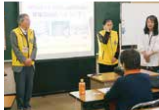
先輩ボランティアの話聞く。(文化財課)

説明会では、3施設を画像で紹介し、ボランティア歴7年と11年のベテランが、軽妙に経験を披露されました。日頃馴染みの薄い「文化財課」ですが、貴重な出土品も見学出来ました。「広島城」では、雪の