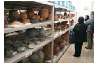
出土品を見せよう。(文化財課)