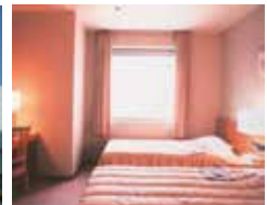
客室(ツインルーム)