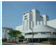
JMSアステールプラザ

■宿泊に関するお問い合わせ・ご予約 URL http://hiyh.pr.arena.ne.jp/