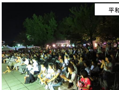
平和のための野外上映会