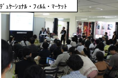
エデュケーショナル・フィルム・マーケット