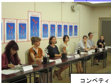
コンペティション受賞者

U R L： http://www.cf.city.hiroshima.jp/index.html