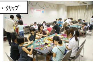
キッズ・クリップ