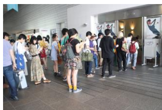
開場を待つ来場者の様子