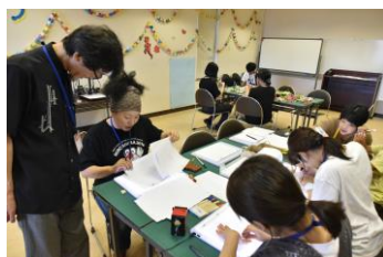
ワークショップ キッズ・クリップ