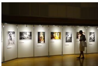
イシュ パテル 写真展