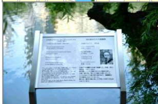
案内板には民喜の詩も記されています

HP（検索：広島市中央公民館）にバックナンバーを掲載しています。ぜひご覧ください