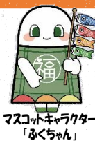
マスコットキャラクター「ふくちゃん」

☆住所 〒732-0029 広島市東区福田四丁目4152-1 ☆Eメール fukuda-k@cf.city.hiroshima.jp ☆ホームページ http://www.cf.city.hiroshima.jp/fukuda-k/