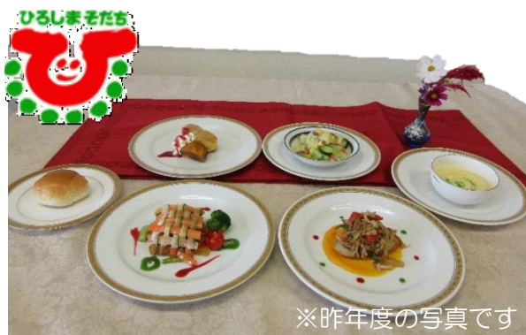
※昨年度の写真です