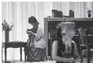
「Alice in Wonderland」(2015) ©松原豊