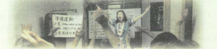
認知症カフェにて、うたごえフラ披露