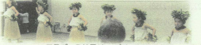
フラダンス披露(キッズチーム)