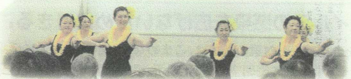
フラダンス披露(大人チーム)