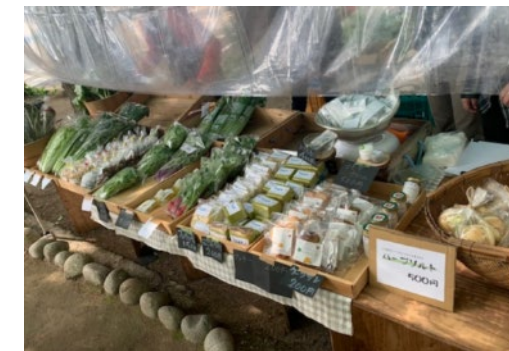
平和大通りひろしま朝市