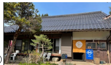
空き家をコミュニティスペースに

そして、6月13日（日）小河内でマルシェやります！ みなさんどうぞお越しください！