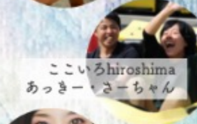
ここいろhiroshima あっきーちゃん