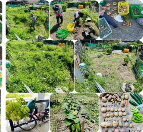
5) なずな菜園7/31じゃが芋収穫