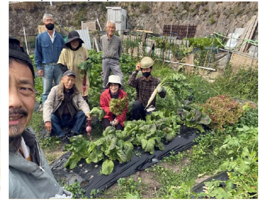
3) 11/6(土)なずな菜園収穫日