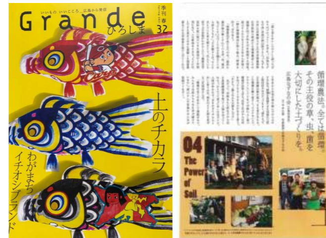
7) 「Grandeひろしま」春号～活動紹介