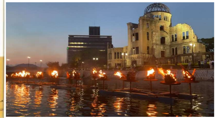
8) 第7回ひろしまかがり灯の祭典」8/5(木)後援参加