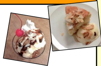
↑デザートもできたものを食べるのではなく3つのCらしく、自分で創ります。