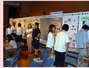
交流の場 になった活 動展示コ ーナー