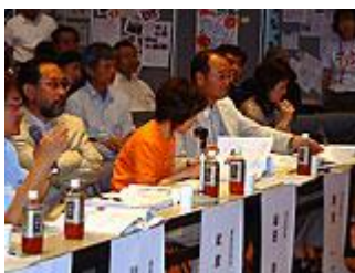
審査する運営委員の皆さん

このファンドは、広島市のまちづくりにつながる市民の皆さんの自主的な活動を助成するもので、今回初めてとなる助成事業には、52団体(団体育成助成部門17件、まちづくり活動発展助成部門35件)からの応募がありました。このうち、発展部門の20団体が公開審査会にエントリーされました。(育成部門は書類選考のみ)。