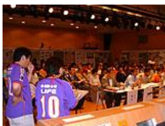
司会はサンフレッチェの ユニホーム！