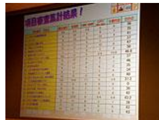
審査結果がスクリーンに……

今年度は、17 団体に総額 3,286,300 円(育成部門 10 団体 500,000 円、発展部門 7 団体 2,786,300 円)が助成されました。今後は、11 月の中間活動発表会、翌年 5 月の最終活動発表会などで、活動の進捗状況が報告される予定。ご期待下さい。