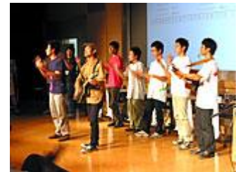
会場みんなで歌い踊った 「まちづくりのうた」

公開審査会は、6人の運営委員による審査・選考の過程だけでなく、さまざまな活動企画の発表を公開することで、市民の皆さんの新たな交流の場になることを狙いとしています。そこで、審査会をスムーズに運営するため、学生や社会人などで構成されたボランティアスタッフ20人が、会場運営、司会進行、交流ひろばなどで会場の雰囲気盛り上げ、参加者の緊張感を和らげてくれました。