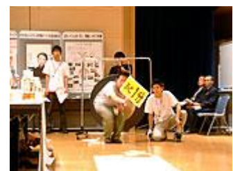
「あと一分！」 時間になると銅鑼が鳴る

3分間のプレゼンテーションでは、それぞれの活動内容をパソコンやビデオなどを駆使して自由に表現し、運営委員の質疑にもよどみのないアピールが行われ、終始熱気に包まれました。「趣旨適合性」「計画実現性」「先駆性・独創性」「市民の関心や参加の広がり」「予算の妥当性」の5項目を3段階評価で集計した中間審査結果が発表された後、各1分間の“最後のひと押し”なるアピール合戦が行われ、いよいよクライマックス。