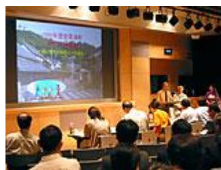
スクリーンを使って プレゼンテーション