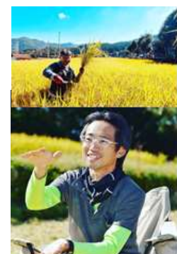
③ふるさと楽舎 FB Facebook.com/furusatogakusya