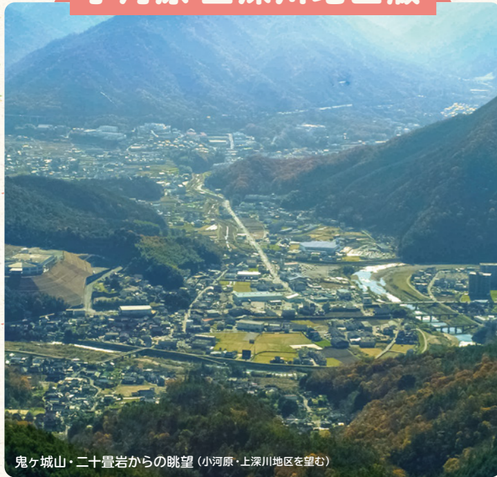
鬼ヶ城山・二十畳岩からの眺望(小河原・上深川地区を望む)

このマップは、小河原・上深川地区の有志が集まり作成したものです。これから歩こうと思っている方、すでに歩いている方も、このマップを利用し、楽しみながら健康づくりに取り組んでみませんか。