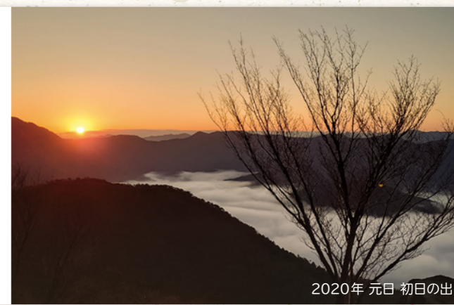
2020年 元日 初日の出

里山鬼ヶ城山(737m)中腹の展望所。眼下に小河原・上深川、遠くに江田島、宮島の浮く瀬戸内海の眺望がある。雲海もまた素晴らしい。雲海より頭を出しているのは木の宗山(412.7m)。見頃は晩秋~冬。