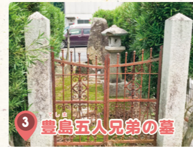
3 豊島五人兄弟の墓

吉川興経公は1550年「悲劇の武将」としてこの地で果てた。ここは吉川興経公の冑塚であり、墓石はなく石が積み上げてある。