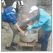
4段重ねのせいで約40分間蒸して、石臼に移す〜熱い!アツアツ!