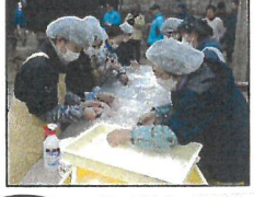
熱い湯き立ての餅を素早く、切り、丸める