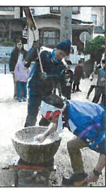
こねる人と打つひとのタイミングが大切

★くろがねもち(黒鉄綱)「苦労がなく金持ち」から縁起木として知られる。冬の終わりに赤い実をつける庭木、街路樹として最大級(10~20m)。実がなるのはメス木のみで、野鳥たちの好物。 ★今年は「うるう年」。うるうとは余りを意味する、太陽暦の365・2422日を4年毎に2月末日に調整する。法律では4年に一度の誕生日の届け出は2月29日です。2月28日24時に年を取るとされる。パリ五輪が7月にあるが、サーフィンやブレイクダンス等が新種目に加わる。なぜか過去総理大臣が変わっている。★名目 GDP が半世紀ぶりにドイツに抜かれ世界4位に転落。一方日経平均株価は4万円台に突入、生活物価は軒並み上昇、好景気の実感なし。このメカニズムはどうなっているのか。 ★昨年4月フィンランドに続き、スウェーデンがNATOに加入。ロシア包囲網がせままる。ウクライナの戦況も2年経過するも、膠着状態。来月ロシアの大統領選挙があるのだが…。★日本の人口減が止まらない。23年度死亡過去最多約160万人、出生数76万弱人=自然減83万超人で、1年で佐賀県の人口が消えたことになる。 ★大谷選手結婚したと発表。噂によれば、お嫁さんは180cmの元バスケット選手らしい。大谷オス、の残念でした。★3月29日のプロ野球開幕が待ち遠しいが、カーブは3/3現在のオープン戦で HR が少ないのが気がかりだ。(写真:草津東一丁目 網岡内科医院のくろがねの木)