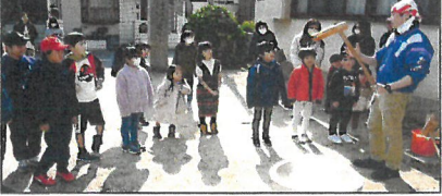
初めての子どもがほとんど