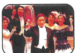
オペレッタ「おもしろ」で主役(中央)を「仮面舞踏会」でこもりおして妻の浮気の疑いをシャンパンで乾杯解決