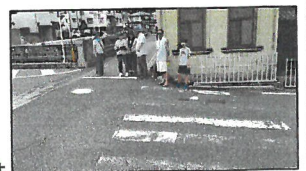
横断歩道をチェック中

◆6月22日(日)に実施した今年で33回目になる「町点検の回答が、西区役所からありました。◆要望事項:横断歩道の設置・線引き等が7件、道路陥没補修が8件、ブロック塀2件、横断歩道橋補修1件、その他3件の計22件を要望した。◆すてに対応済み、今年度中実施が12件、警察等との協議待ちが9件、来年度(R3)に実施予定が1件の回答がありました。◆安全で住みよい街のため、「ご要望」をお寄せください。横断歩道をチェック中