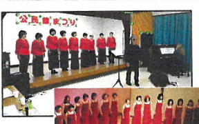
左上:草公祭でマリンエコー 右下:大町「リピーター」のコーラスグループ