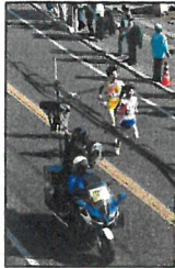
左:往路・草津橋過ぎ 1区1位福島、2位宮城(優勝)が通過 優勝するには1区間でトップ集団に居ることだ

▼広島冬の風物詩になった広島男子駅伝が、1月18日(日)が行われ、平和公園間から宮島付近を折り返す48.0キロで競い、宮島が大谷タイ記録で初優勝した。▼広島は1996年の第1回大会で優勝したのみで、2年連続入賞8位以内を逃がしている。▼スタートの1区を勝が万幸でない選手を出すわけがわからない。宮島街道・草津を28区通過とは応援する観客もがっかり。素人者で高校生の選手起用に問題があるのではと思う。▼復路第6草津橋の中継所で中学生から人抜き頑張るも、アンカーが7区間では追いつづけ13位に終わった。