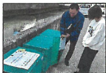
市の担当者から破損した場合レット写しを用意しての補修方法の説明を受けます。

▼破損した市貨物の「ごみ収集枠」の取替えを、東一丁目御幸川沿いと東三丁目エメラルドマンションの2ヶ所行いました。▼市の環境局によると、あまりにも取替え要望が多く、また交換ネットも従来のもので、対応ができないとのことでした。今後は利用者の皆さんが、ホームセンターなどでネットや取り付け部品を購入し、補修してもらいたいとのことでした。▼町内会が費用を持ちますのでお手数ですが、個別に補修をお願いします。なお購入品、補修の手順パンフレット写しを用意しての補修方法の説明を受けます。