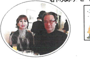
愛妻とツーショット