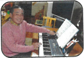
時間を忘れる至福の時 ジャンルは問わず、レパートリーは30曲 童謡の秋からビートルズのレットイットビー、フォークの風、イチゴ白書やホルストのジュピター等