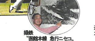
撮鉄 医館本線 急行二七〇