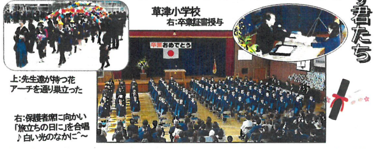
上:先生達が持つ花アーチを通り巣立って 右:保護者席へ向かい「旅立ちの日に」を合唱♪白い光のなかに～

新しい道をめざす君たち また寒さが残る3月、学び舎を巣立っていった。★3月6日(金)広島市立庚午中学校では、24名男子10、女子135名が卒業した。寺川第一校長は「これからの人生は自分だけの正解を探し続ける旅だ。笑顔で自信をもって歩んでほしい」とはなむけの言葉を贈った。★3月19日(木)広島市立草津小学校でも卒業式が行われ、125名男子58名、女子67名が巣立っていった。久野哲治校長は「一人のつなかりを大切に、感謝の気持ちと自分の夢を目標に、中学校生活を送るよう」と励ましの言葉を贈った。★広島市立草津保育園では、3月23日(月)卒園式を行い、園児31名男子18、女子13名が卒園。内草津小学校に13名が入学予定。