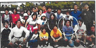
18~50才専門学校同期生のO内木谷さん 人生経験をよく受けた