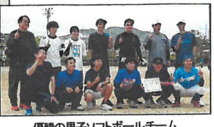
優勝の男子ソフトボールチーム