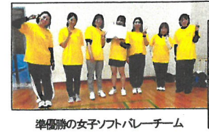
準優勝の女子ソフトバレーチーム

草津東ソフトボール男子優勝&レポール女子準優勝! ▲4月19日(日) 西区スポーツセンターで、ソフトボール・ソフトバレー大会が行われた。▲草津東は男子ソフトボールが優勝。女子バレーボールは準優勝と輝かしい戦果をあげました。