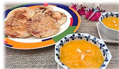
【MENU】 韓国のお菓子ホットク(甘いおやき)と ホバクチュ(かぼちゃの甘いおかゆ)