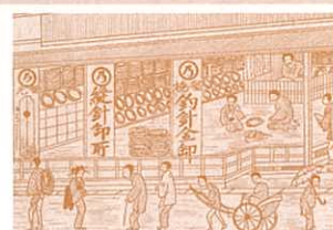
明治時代の針商 『広島諸商仕入買物案内記』より 当館蔵

全国的に広く知られている企業や製品の中には、広島発祥であったり、広島が大きなシェアを持っていたりしながら、そのことが案外知られていないケースがあります。今回の展示では、そうした事例の中からモノづくりに関わるものをご紹介します。