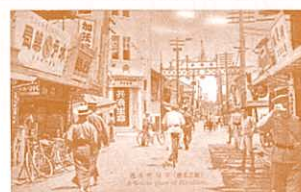
大正時代 絵葉書(広島名勝)鞆町本通

江戸時代に広島城下に引き入れられて以降、今日まで広島有数の繁華街としてにぎわってきた本通筋。その歩みを通して郷土の移り変わりを振り返るとともに、これからのまちづくりを展望します。