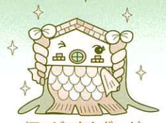
〈アマビエれんがール〉

HIROSHIMA CITY MUSEUM OF HISTORY AND TRADITIONAL CRAFTS