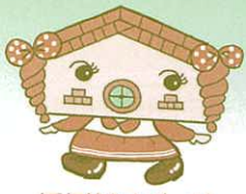
〈看板娘 れんがール〉