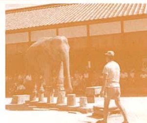
昭和33年(1958) 宇品天然水族館での象のショー

宇品島(現元宇品)は、今から約140年前の宇品築港事業により陸続きとなりました。以降、リゾート地ともなった島の移り変わりや住民の暮らし、歴史の痕跡について紹介します。