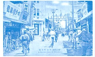
大正時代 絵葉書(広島名勝)革屋町本通

広島城下に引き入れられて以降、今日まで広島有数の繁華街としてにぎわってきた本通筋。その歩みを通して郷土の移り変わりを振り返るとともに、これからのまちづくりを展望します。