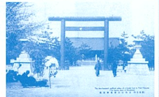
比治山にあった御便殿(個人蔵)

かつては広島湾に浮かぶ島で、その後陸続きとなった比治山や黄金山、江波山・皿山を取り上げ、陸・海・川の接点で生まれたそれぞれの山とその周辺の歴史や文化などを紐解きます。