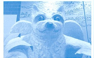
狗寶(くひん)さん 宇品島に伝わる伝説で天狗の一種

夏に話題となる「おばけ(妖怪や化け物)の世界」を紹介するとともに、おばけを生み出した昔の人々の暮らしや思いも紹介します。昔の「おばけ屋敷」の疑似体験もできます。