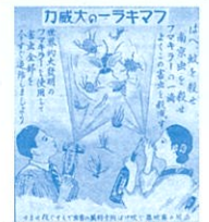
「強力アマキラー液」広告(一部) 昭和6年頃(当館蔵)

全国的に広く知られている企業や製品の中には、広島発祥であったり、広島が大きなシェアをもっておりながら、そのことが案外知られていないケースがあります。今回の展示では、そうした事例の中から日用品に関わるものをご紹介します。