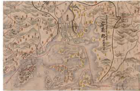
正保安芸国絵図(部分) 守屋壽コレクション 広島県立歴史博物館蔵・写真提供