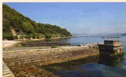
似島 旧軍用棧橋の現状

※内容、講師等は変更する場合があります。 ※参加申込み方法は裏面をご覧ください。