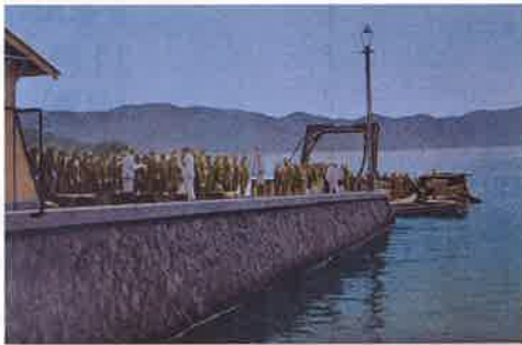
似島陸軍検疫所絵葉書 上陸棧橋 個人蔵