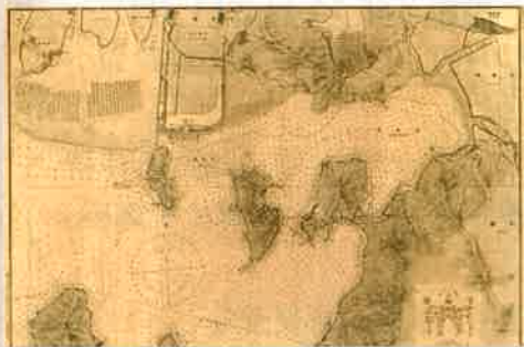
明治37年の宇品港の様子 海図「宇品港」より 海上保安庁蔵