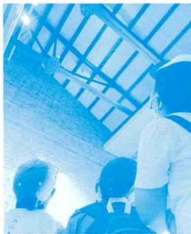
原爆の爆風で曲がった屋根の鉄骨の説明(昨年の様子)

うじなりくんりゅうまつしじょう 被爆建物である当館は、旧宇品陸軍糧秣支廠の缶詰工場でした。建物の概要説明や宇品港から出兵する様子を記録した映像の上映を行います。常設展示室には戦時中の住居を再現しています。