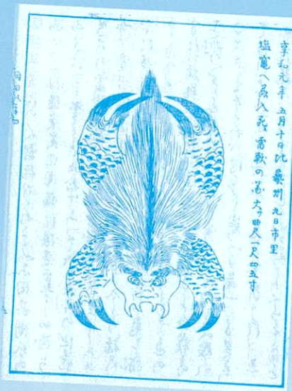
享和元年(1811)五月十日比叡州九日市里 塩竈へ参入兵、香歌の島、大つゆ八、尺四五寸