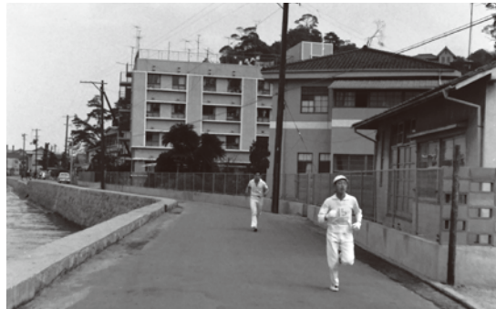
◀ 第4回元宇品 3周マラソン大会

申込:往復はがきに、①イベント名、②郵便番号・住所、 ③氏名(フリガナ)、④年齢、⑤電話番号を明記 のうえ、5月15日(月)必着で広島市郷土資料館 へ(応募者多数の場合は抽選)。