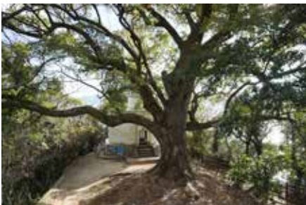
◀ 樹齢140年以上の クスノキの巨樹

かつて宇品築港の 護岸工事を請け負った 服部長七の事務所、 作業場、住宅のあった 付近を走る参加者 昭和40年(1965)撮影 大宮利信さん蔵