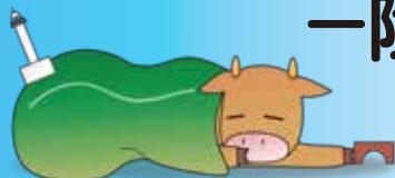
展示ナビゲーター「うし奈ちゃん」