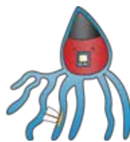
広島デルタの妖精 「でるたこ(初代)」