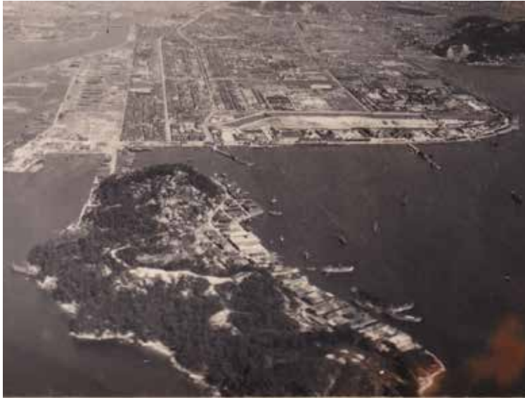
昭和20年(1945)原爆投下後の宇品と元宇品(手前) 原生林の残る西側(左)と、民家や造船所が密集し、船が停泊する 東側(右)。写真中央の山頂には陸軍の高射砲陣地、南側(右下) には、機銃陣地らしきものが見える。

令和5年(2023)5月に「G7広島サミット」会場地となる「宇品島(元宇品)」は古来、樹木の伐採や開発が制限された原生林があり、伝説や逸話も多く神秘的な孤島でした。今から139年前の明治17年(1884)、広島県令・千田貞暁のもと、5年にわたる宇品築港事業が始まり、宇品島は干拓地の宇品と1本の道でつながりました。明治37年(1904)には、安芸郡仁保島村宇字宇品島から広島市に編入され、元宇品町が誕生しました。