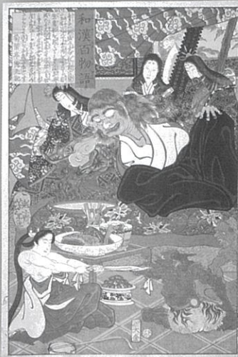
一魁齋芳年『和漢百物語[酒呑童子]』 慶応1

ふしぎ きみょう 「不思議だ」「奇妙だ」ということに出会ったとき、昔の人は人ではないものの存在を感じていました。おばけ(妖怪)を通して人々の想いや生活に向き合う楽しい? 企画展です。