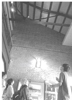
原爆の爆風で曲がった屋根の鉄骨の説明(昨年の様子)

日時 8月6日(日) 9:00~16:30 (「一銭洋食づくり」は10:00~16:00 ただし材料がなくなり次第終了します)