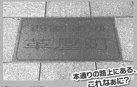
本通りの路上にある、これなあに?

*はがき1通につき3人まで申し込みます。*乳幼児の同伴はご遠慮ください。*はがきの記入には消せるボールペンは使わないでください。