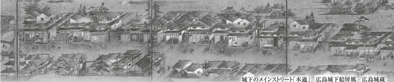
城下のメインストリート「本通」 広島城下絵屏風 広島城蔵

その昔、広島城下に西国街道が引き入れられてから始まる、「本通」の物語。今日まで広島有数の繁華街としてにぎわってきた本通筋の移り変わりや思い出の景色を紹介しながら、これからのまちづくりも展望します。