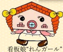
看板娘“れんがール”