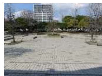
宇品西公園（郷土資料館北隣）