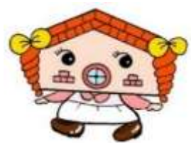
看板娘 れんガール