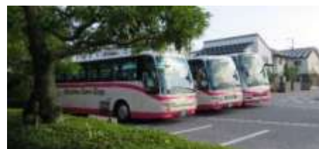
大型バス駐車 最大3台まで