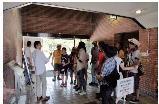
被爆建物案内の様子

当日は、ボランティア・スタッフ（広島歴史探検隊）や博物館実習生の応援を得て、たくさんの来館者で賑わいましたが、今年は被爆70周年ということもあり、来館者の関心がいつも以上に高かったように思えました。