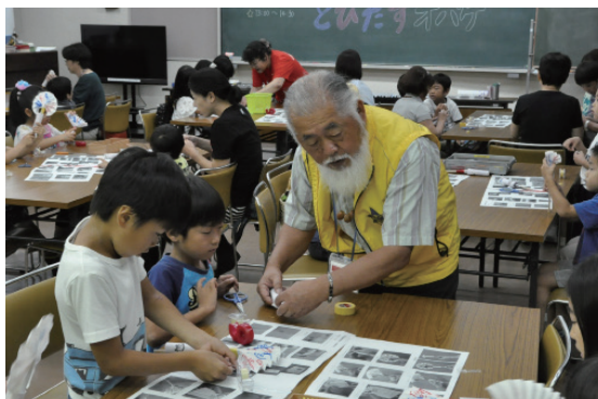
カンタン工作「とびだすオバケ」