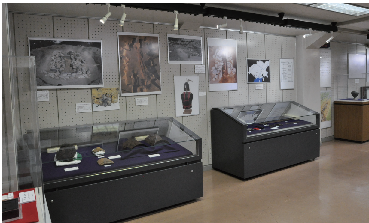
企画展「ひろしま再発見2」 展示風景