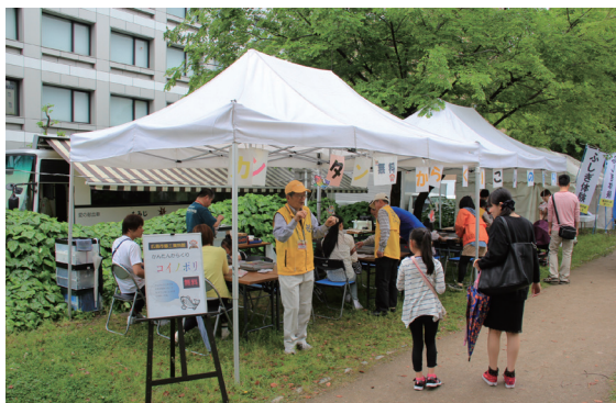
フラワーフェスティバル会場にて 「かんたんからくりコイノボリ」