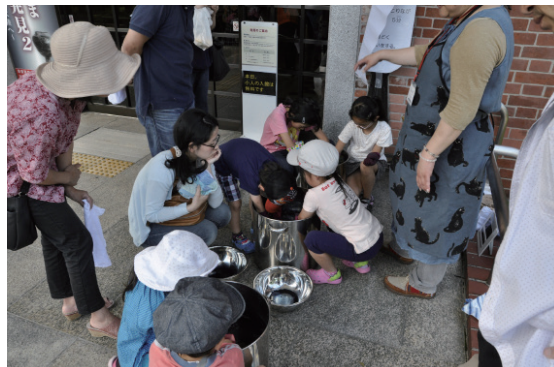
教室事業 6月6日 「藍でハンカチ染め」