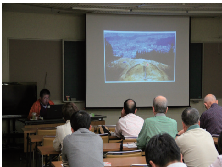
企画展関連講座の様子