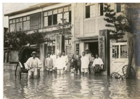
▲「広島県太田川水害実況写真」より 大正15年9月洪水 幟町小学校前浸水状況 (広島市公文書館蔵)

今年は平成13年(2001)3月の芸予地震の発生から20年目にあたります。最新の地震研究によると、この地震は概ね50年周期の発生が指摘されています。近世以降で記録が残っているもののうち、地震の規模や被害の範囲などから、芸予地震の名称で呼ばれている明治38年(1905)と平成13年のものに加え、慶安2年(1649)・貞享2年(1685)・享保18年(1733)・安政4年(1857)・昭和24年(1949)が該当するとされています。また、南海トラフを震源とする地震の一つ、嘉永7年(1854)の安政南海地震では、『村上家乗』(広島大学文学部日本史学研究室蔵)や『老いのくりごと』、『御旧記』(いずれも広島県立文書館蔵)などの文献資料から城郭や屋敷など建物の被害や当時の城下の人びとの騒然とした様子をうかがうことができます。