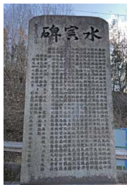
地域に残る水害碑

現在の広島県の町は、太田川が広島湾へそそぐ河口部に土砂が堆積してできた三角州の上に成り立っており、町の成り立ちの基礎は広島城が築城される16世紀後半にさかのぼります。川や海に近い立地は、城の防衛面に加え、漁業などの生業 なりわい や生活用水など人びとの生活を支える糧として、また川や海を利用した水運と陸上の街道筋とが交わる交通の要所となり、広島城下の発展を支える大きな役割を果たしました。江戸時代以降、街の発展とともに干拓と埋め立てによって土地を拡げ、海岸線は現在の平和大通り付近から南へ約2km延びたとされています。明治以降も、宇品港築港や広島工業港の建設計画、太田川放水路建設による埋