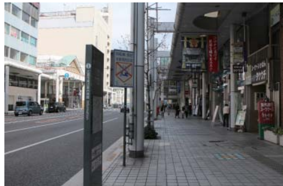
写真3 天満屋小路があった場所の現状（当館撮影） 広島アサヒビール館付近から北に向かって撮影