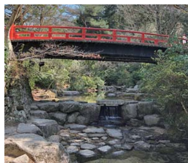
▲紅葉谷川庭園砂防の様子(画像は流路工付近)

昭和20年9月の枕崎台風での土砂崩れ復旧のため、景観保持と治水砂防機能の両立を目指して建設されました。令和2年12月、戦後の土木建築として初の国の重要文化財に指定されました。