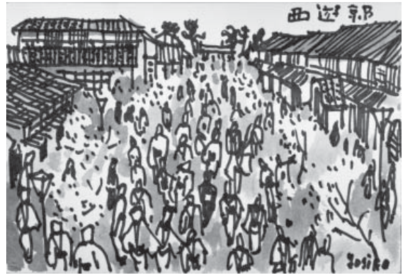
写真1 西遊郭 「続々がんす横丁」p.62掲載