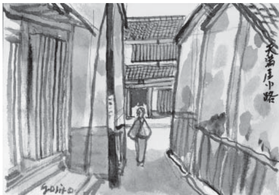
写真2 天満屋小路 「続々がんす横丁」p.62掲載

「がんす横丁」のあとがきによると、福井氏はこれらの絵を記憶に頼って描かれたようです。おそらくは実際にその場所に立ち、記憶の中のかつての風景を思い起こして描き出したのでしょう。そのため、やや正確さにかける部分もありますが、今は私たちが味わえない当時の空気感を知ることができるのです。企画展をとおして福井氏のさし絵の魅力の一端が伝われば幸いです。（本田美和子）