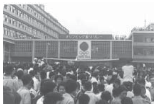
広島県庁にオリンピック聖火到着

昭和39年(1964)、東京オリンピック当時の広島の出来事や暮らし、流行について、57年後の現在と見比べながら、原爆投下から19年経った高度成長期の広島を振り返ります。