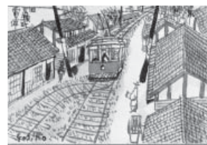
「旧広瀬町電停」福井芳郎 画(広島市公文書館蔵)

戦前の広島の路地や盛り場、世相、風俗について紹介した『がんす横丁』(シリーズ全4冊)に掲載されている地元の作家・福井芳郎氏によるさし絵の原画を中心に、当時の町や一般の人々の生活の様子を紹介します。