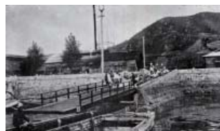
似ノ島陸軍検疫所絵葉書 上陸棧橋(個人蔵)

戦前に陸軍の港として機能していた宇品港。この軍用港を支えた似島・金輪島の役割にスポットを当てて紹介します。