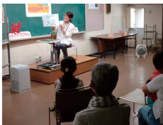
司書の先生による「ごんぎつね」読み聞かせ