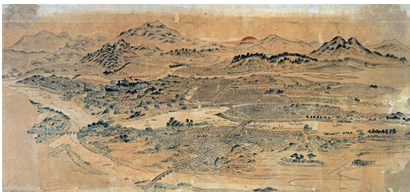
『広島全景図』（広島城蔵）

広島城の西にあたる現在の西区己斐付近から江戸時代の終わりに近い時期の広島城下の景観を描いた鳥瞰図 ちようかん 。西国街道 うんせき や雲石街道、街道筋の町並み、城下を取り巻く太田川の分流の様子や川を上り下りする舟運など、海や川に近い立地と城下町全体の様子をとらえることができます。