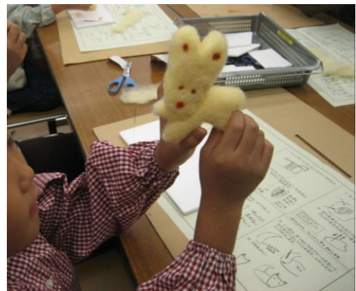
ふわふわのごんぎつねができました。

また、同じく関連の教室として「ごんぎつねの人形作り」を実施しました。羊の原毛を染めたフリースを丸め、特別な針で突き固めていくと、フェルトのごんぎつねが誕生します。針を使う製作でしたが、十分注意して作業しましたので、園児や小学校低学年のお子さんにもかわいいごんぎつねを作ることができました。