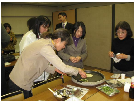
懐かしく感じる方もあれば、新鮮な感動を覚える方も

来年度以降も4館が連携し、資料館などがそれぞれ1館ではできないサービスマスターを提供していきたいと考えています。(小林奈緒美)