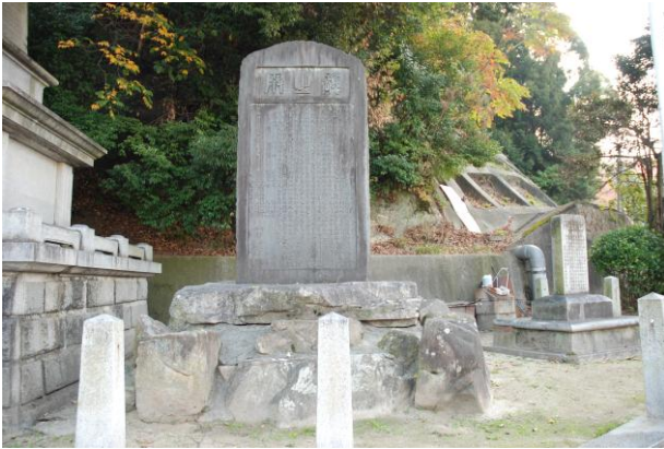
矢野・尾崎神社下に見られる「 かもじ 之碑」

広島市安芸区矢野地区でかつて盛んであったかもじづくりは、「矢野かもじ」と呼ばれる広島伝統的地場産業の一つです。今回の展示会は、この矢野かもじの歴史、かもじ・かつらづくりの工程や製品のほか、現代に受け継がれた伝統技術について紹介し、矢野かもじを通して郷土広島のことをもっと知ってもらおうと企画したものです。