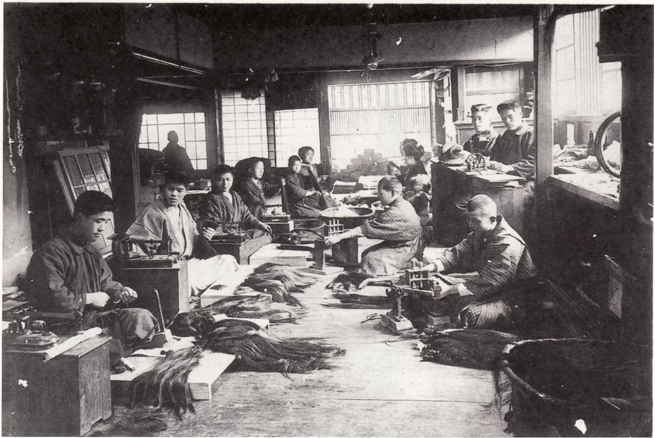
大正 11 年(1922)ころのかもじづくりの作業場

「矢野かもじ」は、広島伝統的地場産業の一つであり、かつては「熊野の筆」、「備後の畳表」と並んで広島県の三大特産として広くその名を全国に知られていました。今ではほとんどその名は聞かれなくなりましたが、現在も広島県の伝統的工芸品に指定されています。