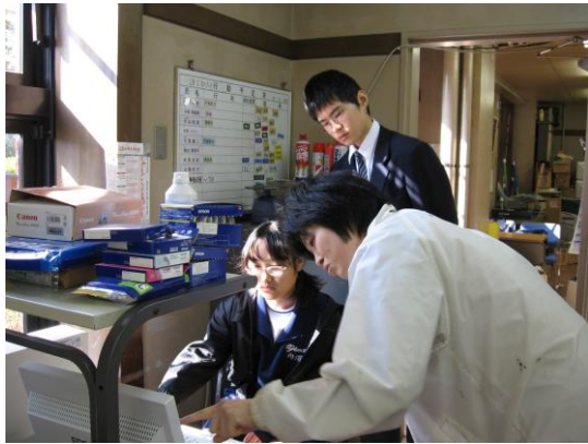
パソコンで資料のデータを入力(宇品中学校生徒)。

本年度は、国泰寺中学校・宇品中学校の2校から、職場体験実習生を受け入れました。職場体験学習のねらいは、これから社会に踏み出していく中学生に、学ぶことの意義や働くことの意味を理解し、主体的に進路を選択決定する態度や意志、意欲などを培ってもらうこととされています。当館としても、次世代を担う子どもたちを社会全体で育成するという観点に立ち、学校の取組やその活動を積極的に支援・協力するのはもちろん、博物館という施設でどんな仕事をしているのかについて知ってもらうよい機会と考えています。