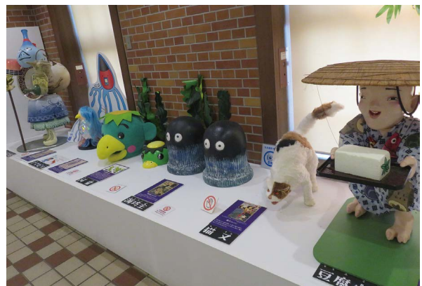
1階展示 はじめてのおばけ屋敷(疑似体験)コーナー