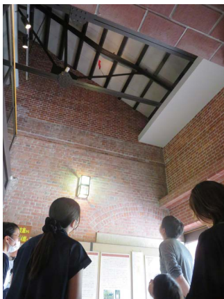
玄関ホール 曲がった鉄骨の説明

被爆80年の8月6日(水)に「郷土資料館、被爆建物案内」を行いました。被爆建物(爆心地から3.2km)である当館は、明治44年(1911)に建設された「旧宇品陸軍糧秣支廠」の缶詰工場でした。