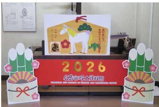
日本一早い 年賀メール・年賀状作成コーナー

今年の夏も大変暑い夏になりましたが、しかし、いつかは冬になり、お正月がやってきます。寒い冬のことを考えて涼しくなっただけと計画したコーナーです。来年の干支は「馬」。来年も(こそ)良い年でありますように。