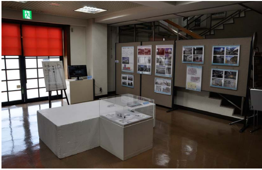
一階展示ロビーでの展示