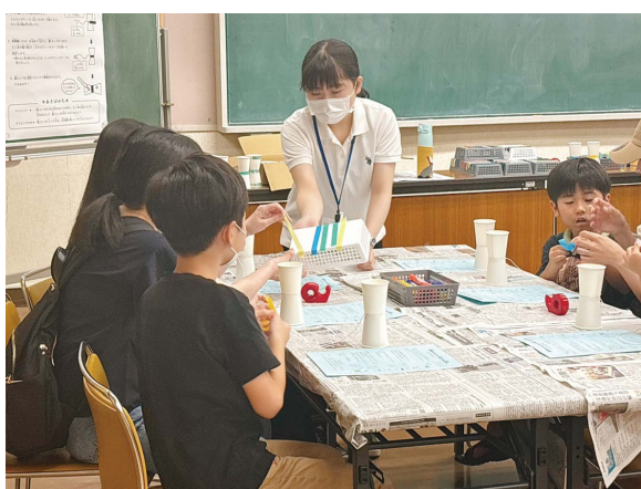
わくわくイベントの指導