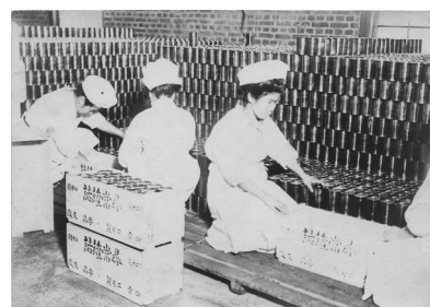
糧秣支廠缶詰工場 箱詰め作業

当館の前身である旧宇品陸軍糧秣支廠缶詰工場について、その役割や歩みを、当館に収蔵されている写真や道具類を通して紹介します。