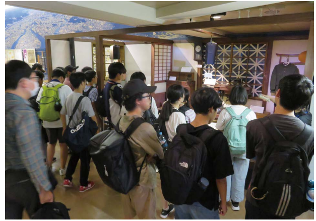
「昭和の茶の間と台所」(戦時中)の説明を聞いている来館者