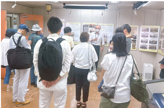
展示ガイドの様子