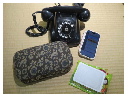
変化した暮らしの道具

被爆から80年、その間に私たちの暮らしも劇的に変わりました。過去と現在を行きつ戻りつ、暮らしに関わる「もの」を比べて違いを実感することで、歴史や営みの移り変わりを振り返ります。