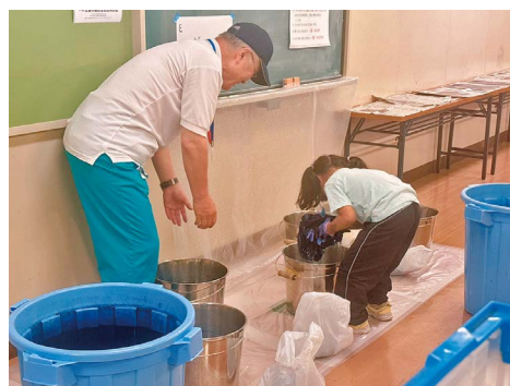
藍染め Tシャツ作り