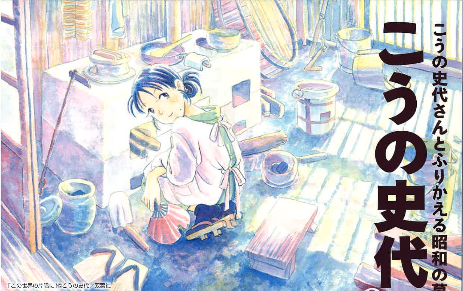
「この世界の片隅に」©この史代 / 双葉社