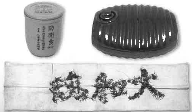
写真 (左上): 防衛食器 当館蔵 (右上): 陶製湯たんぽ 当館蔵 (下): 「大和魂」と縫い込まれた千人針 当館蔵