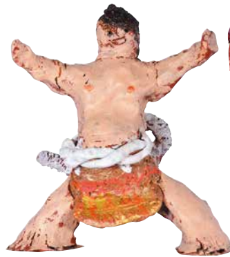
【さあかかってらっしゃい!】 柳島 隆英