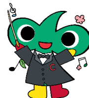
中区のまちづくりマスコットキャラクター 「なかちゃん」

新型コロナウイルス感染症拡大防止のため、今後、催しが中止となる可能性があります。最新の状況は、当プラザホームページをご確認いただくか、電話でお問合せください。(中止となった際には、申込済の方にはこちらから連絡いたします。)