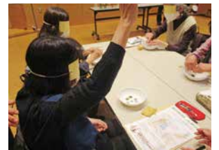
▲コインゲームで触覚体験