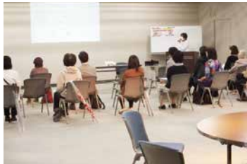
▲ミニセミナーの様子

具体的にどのような物から片付けると取り組みやすいのか、また、すぐには片付けられない物は一時的に保管し、心を整理してから片付けると進めやすい等、気持ちがつらくなりやすい片付け方法の紹介もあり、参加者からは「先延ばしにしないで出来ることから始めたい」と前向きな感想がありました。