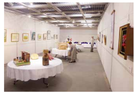
▲作品展(ギャラリー)の様子