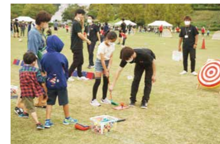
▲ターゲットゴルフの様子

URL http://www.sports-or.city.hiroshima.jp/lesson/sporec