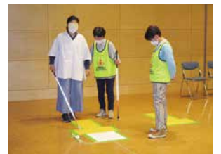
▲アイマスクと白杖を使い歩行体験

また、「座学とゲーム等の体験が組み合わせられ、バランスよく学べて満足できた。」「もっと時間を長く設定してほしい。」等の声があり、講座の続編について、考えるきっかけをいただきました。『障害を知り、共に生きる』そのために自分は何ができるのかを考えることが、ボランティアに参加する第一歩です。今後も「こんなひと声・こんな援助が助かります!」の声と気持ちに寄り添っていくことを講座を通して広めていきたいです。