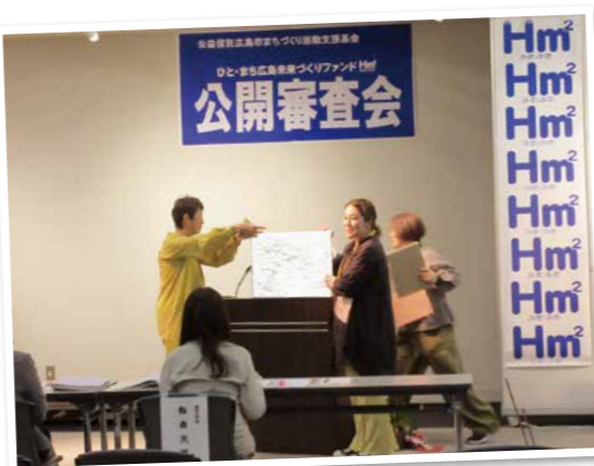
▲第21回助成事業公開審査会の様子

公益信託広島市 まちづくり活動支援基金 ひと・まち広島 未来づくりファンド ふむふむ Hm 2