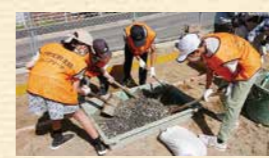
▲かまどベンチを作る様子 (ジュニア防災リーダー養成活動)

広島市東区早稲田学区内における社会福祉活動の効率的な運営と組織的推進、地域住民の社会福祉に対する理解と関心を住民が一致協力して行うことを目的に、平成12年6月に発足しました。