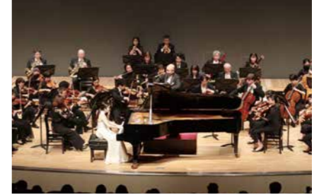
▲昨年度(2022)のコンサートの様子