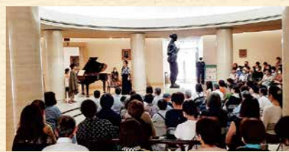
▲ミュージアム・コンサートの様子 (令和5年9月9日)

昭和53年に創業100周年を迎えた広島銀行が、地域と共に歩んだ戦後の歴史の記念事業として同年11月に「ひろしま美術館」を設立・開館。広島が平和文化都市の建設を目指し、市民が一体となって歩んできたなか、人々が必要としていたのは心の喜びとやすらぎの場であると考え、「愛とやすらぎのために」をテーマに、原爆犠牲者への鎮魂と平和への願いを込めて構想10数年を経て誕生しました。