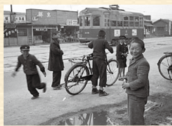
▲「せんだまち写真散歩」で展示した写真 1953年2月／中区東千田町・電車通り／ 「家の前」・通りの市電と子ども達

これから人々の感性を刺激し、日常に新たな視点をもたらしてくれるアート作品を通じて、千田町の活性化を目指します。