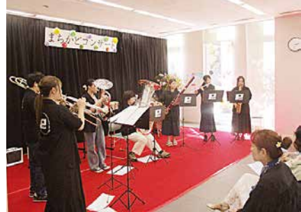
▲前回のコンサートの様子