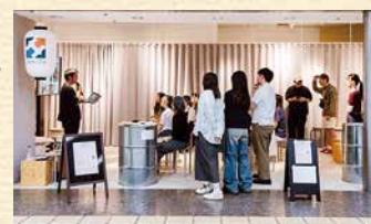
▲紙屋町シャレオ内の広島都心会議ショールームで開かれた「第7回継ぎ矧ぐ」の様子(令和7年8月)

主な活動としては、①地域活動に参加する、②地域づくりを行っている人の話を聞く、③学生が地域づくりを行っている現地を訪れる、この3つ。中でも、地域づくりを行っている人の話を聞く活動は、セミナー「継ぎ矧ぐ」と題して、これまで2年間で8回開いています。「初めはセミナー継ぎ矧ぐに社会人の話を聞く側として参加していましたが、3回目以降は運営スタッフとして関わるようになりました。社会人の方と話をすると、普段同級