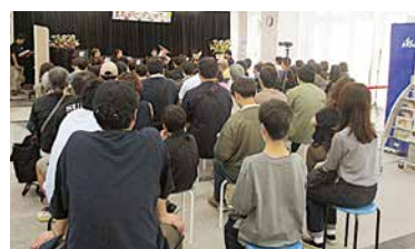
▲たくさんのご来場ありがとうございました