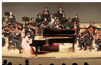
▲昨年度のコンサートの様子

後 援 広島市、広島市教育委員会、中国新聞社、NHK 広島放送局、中国放送、広島テレビ、広島ホームテレビ、テレビ新広島、広島エフエム放送、FM ちゅーピー 76.6MHz、ちゅぴCOM