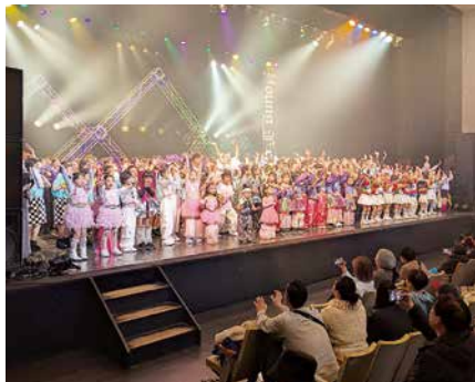
▲昨年度のヤングフェスタの様子