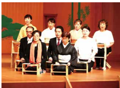
▲前回の発表の様子