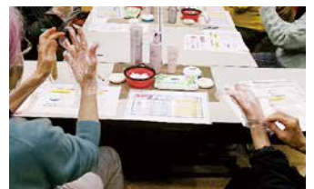
▲ハンドクリームでマッサージ