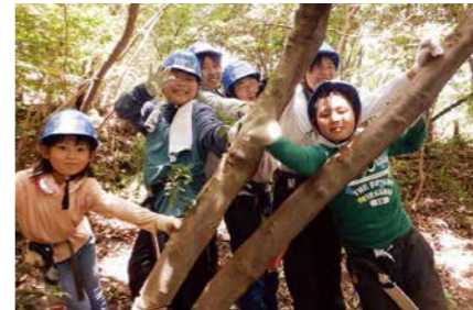
▲昨年の活動の様子