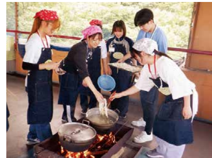
▲昨年の野外炊飯の様子