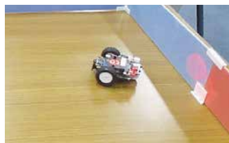
▲壁を検知して方向転換する命令を実行している