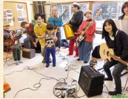
▲三篠公園内の集会所での練習の様子

今後は、地域のさまざまな団体や、音楽グループとの交流をさらに広げて、世代を超えた繋がりをより深めていきたいと、新たな目標も持って活動しています。