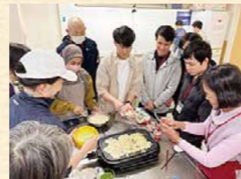
▲一緒にたこ焼きを作って交流