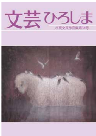
▲「文芸ひろしま」第34号