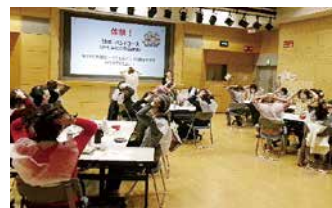
▲頭皮ケア専用化粧品を頭につけてマッサージ