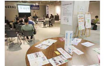
▲ 成果発表会&公開審査会

また、この【情報誌「らっくく」】に、左頁のような取材記事が掲載されます(ただし、全ての団体が掲載できるとは限りません)。らっくくは、市内71館の公民館や全国の生涯学習センターなど、様々な施設へ配付されており、活動PRの一つとして活用いただけます。