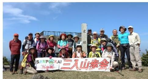
令和6年4月 山口県周防大島町