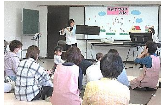
4月ミニコンサートの様子♪