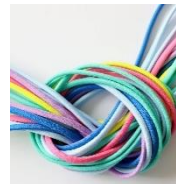
「ループエクササイズバンド」 当日貸出します。