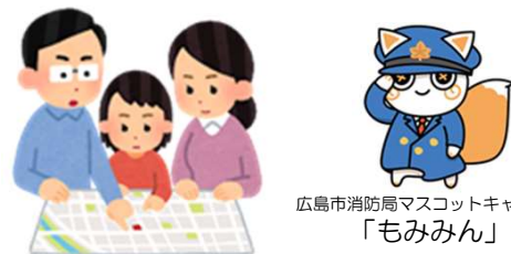
広島市消防局マスコットキャラクター「もみみん」

『お出かけは マスク戸締り 火の用心』 佐伯消防署予防課 TEL 921-2236