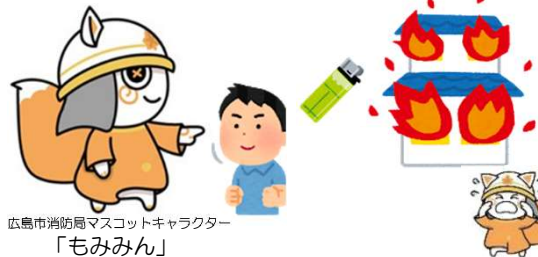
広島市消防局マスコットキャラクター