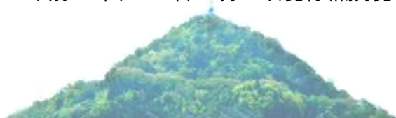
公民館から見た黄金山山頂